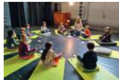
Des exercices de respiration...

Après quelques mois d'expérimentation, les bénéfices se font déjà sentir. Les élèves apprennent à se centrer plus facilement, sont plus calmes et concentrés. Ils gagnent en